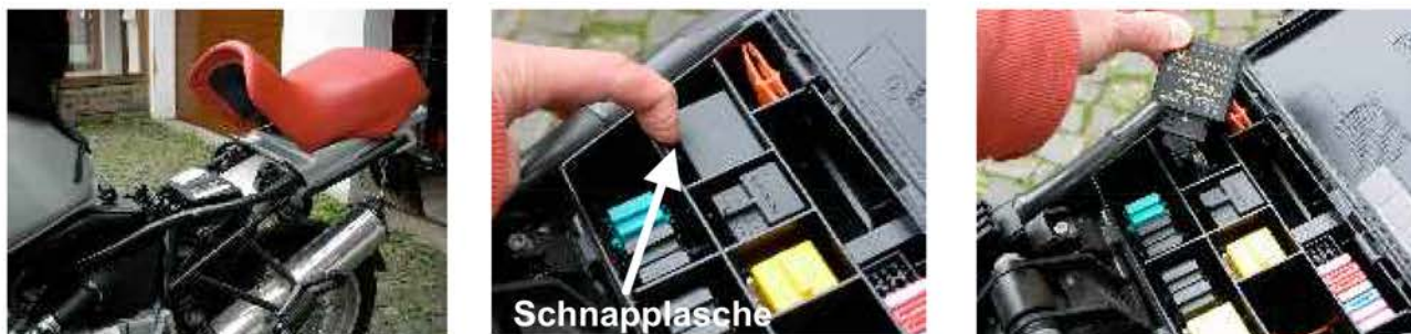
Bild 2 Schieben Sie die Schnapplasche zurück und ziehen das Blinkrelais Bild 3 heraus.

Bild 1 Schalten Sie vor dem Umbau bitte die Zündung Ihres Motorrades ab. Nehmen Sie die Sitzbank herunter. Entfernen Sie den Deckel des Sicherungs- und Relaiskastens.